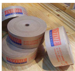
Papel Engomado Impreso