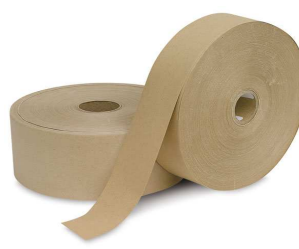
Papel Engomado Simple