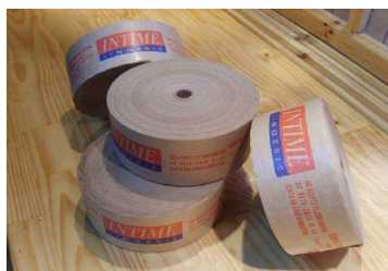
Papel Engomado Impreso