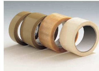
Cintas de Embalaje con o sin impresion