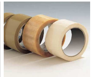
Cintas de Embalaje