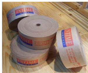
Papel Engomado Impreso