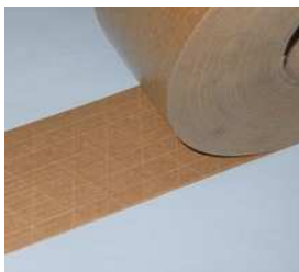
Papel Engomado Tejido