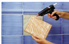
Aplicador de Adhesivo 3M y Stopgard