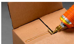
Pistola Polygum 3M y Adhesivo Hotmelt 3M