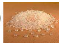
Adhesivo Hormelt Granulado