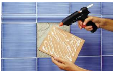
Aplicador de Adhesivo 3M y Stopgard