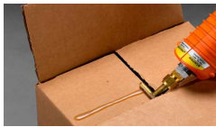
Pistola Polygum 3M y Adhesivo Hotmelt 3M