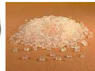
Adhesivo Hormelt Granulado