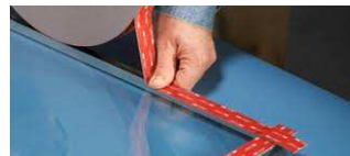
Cinta Doble Contacto VHB de 3M