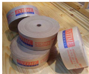
Papel Engomado Impreso