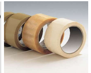
Cintas de Embalaje