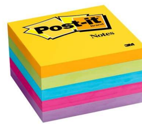
Cintas Con Adhesivo Removible