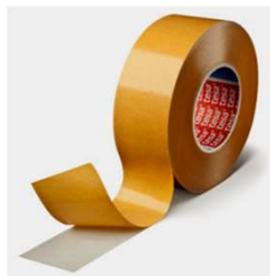
Transferible 4970 TESA